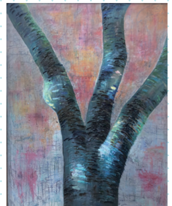
■青楓賞 3年 半田