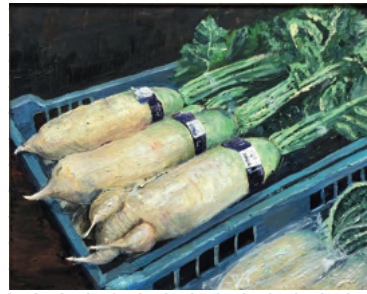
■絵画部門（油彩） 優秀賞 2年 浦島