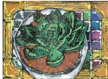
■版画部門 奨励賞 2年 稲岡